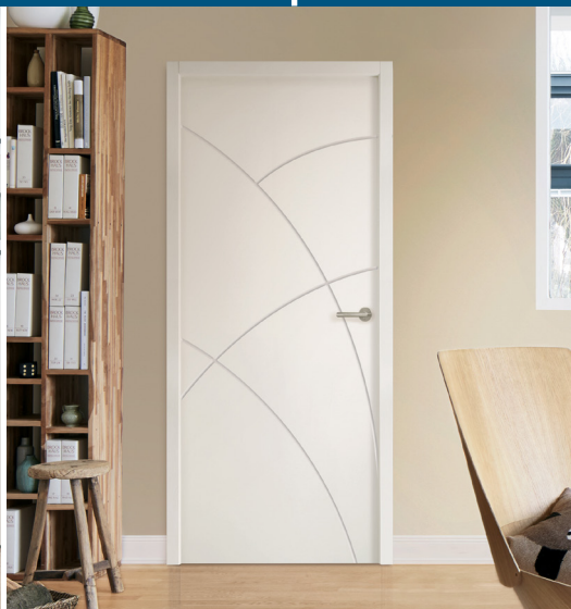
Porte rainurée Groove