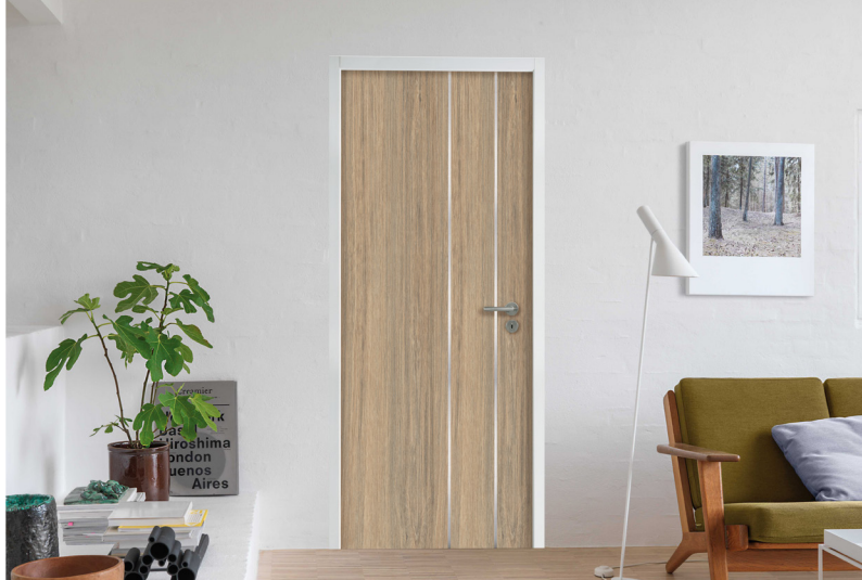
Porte Stratifiée Griffée