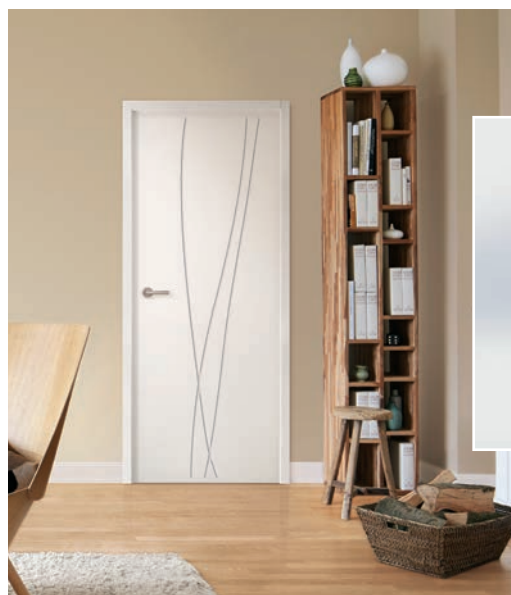
Huissierie écharpée (1 vantail)