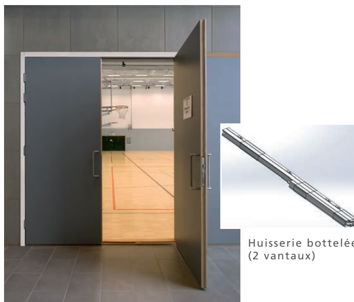
Huissierie bottelée (2 vantaux)